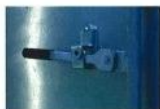
施錠もできるので安心