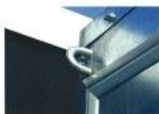
クレーンで吊り下げ可能